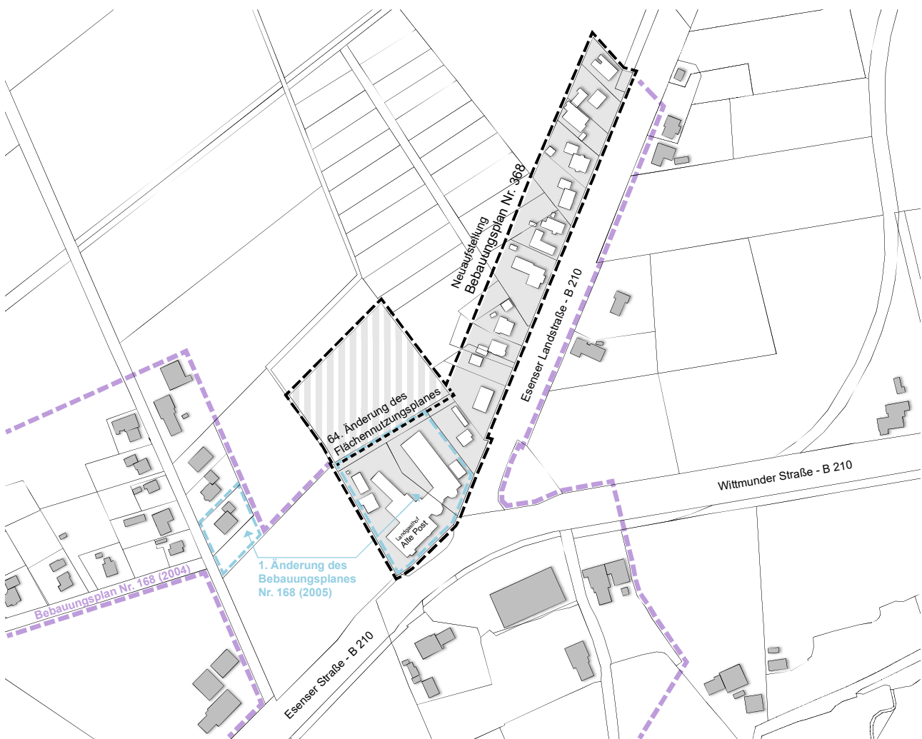
Abb. 1: Übersichtsplan Bauleitplanung

Wesentlicher Bestandteil des Plangebietes des Bebauungsplanes Nr. 368 ist der traditionsreiche Landgasthof „Alte Post“, ein privat geführtes Hotel mit 4-Sterne Ausstattung. Die Rahmenbedingungen für Betriebe des Beherbergungsgewerbes haben sich in den letzten Jahren in Ostfriesland deutlich verändert. Neben stetig steigenden Übernachtungszahlen werden auch zunehmend Angebote für den mobilen Tourismus (Wohnmobilstandplätze mit angeschlossener Gastronomie), Tagungsveranstaltungen und Wellnessangebote nachgefragt. Gastronomische Betriebe wie der Landgasthof „Alte Post“ finden sich insoweit in einem verschärften Anforderungsfeld wieder. Die bestehende Bauleitplanung in Ogenbargen wird dieser Entwicklung heute nicht mehr gerecht, da insbesondere Flächen für die bauliche Erweiterung und Umstrukturierung des Betriebes fehlen.