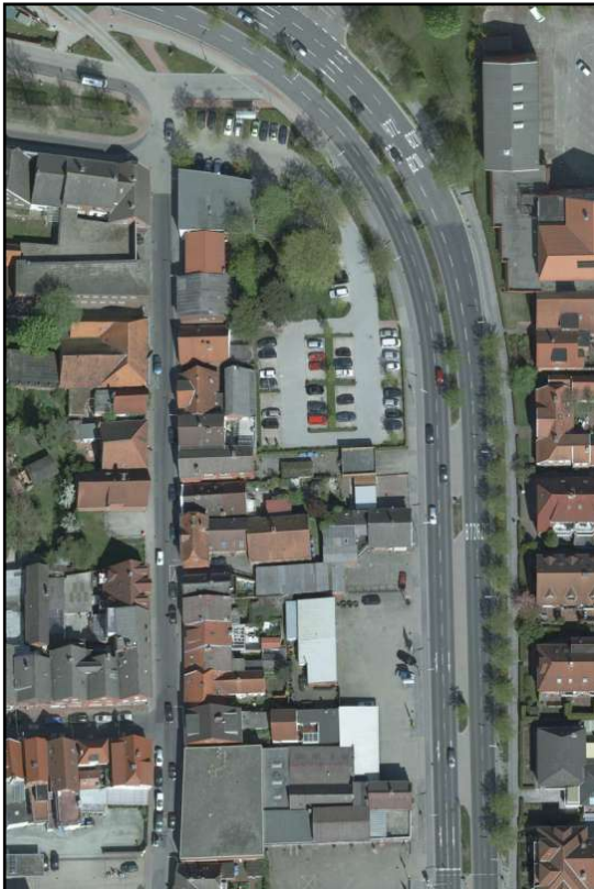
Abbildung 2: Luftbild

Aus der Plangrundlage und dem Luftbild geht der hohe Versiegelungsanteil durch Haupt- und Nebengebäude sowie Parkplatzfläche und Wege hervor. Die verbleibenden unversiegelten Restflächen sind neben den vorhandenen Bäumen (s. Baumkataster) mit Ziersträuchern und sonstigen Abstandsgrün bewachsen.