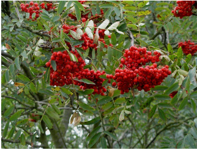
Viele fruchttragende Baum- und Straucharten auf der Wallhecke sind bedeutsame Nahrungsquellen für die heimische Vogelwelt; Foto: Eberesche (Vogelbeere)

Der Ausgleich verloren gehender Wallhecken durch Neuanlagen dient dem Erhalt des Landschaftscharakters und der Ergänzung dieser für die Ostfriesische Geest so typischen und einzigartigen, von Ostfriesen wie auch Touristen geschätzten, parkähnlichen Wallheckenlandschaft, sowie auch der Bewahrung der vielfältigen ökologischen Wertigkeiten von Wallhecken.