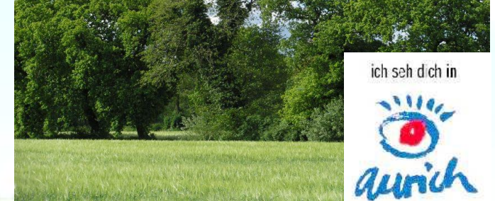
Die Umgebung Aurichs ist ohne Wallhecken nicht vorstellbar