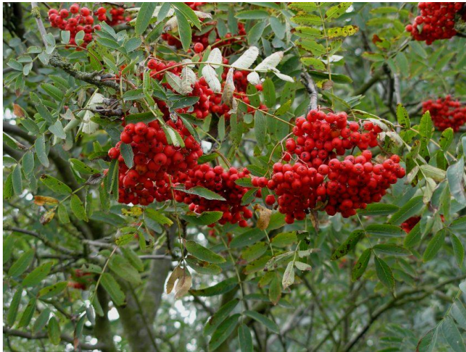
Viele fruchttragende Baum- und Straucharten auf der Wallhecke sind bedeutsame Nahrungsquellen für die heimische Vogelwelt; Foto: Eberesche (Vogelbeere)

Der Ausgleich verloren gehender Wallhecken durch Neuanlagen dient dem Erhalt des Landschaftscharakters und der Ergänzung dieser für die Ostfriesische Geest so typischen und einzigartigen, von Ostfriesen wie auch Touristen geschätzten, parkähnlichen Wallheckenlandschaft, sowie auch der Bewahrung der vielfältigen ökologischen Wertigkeiten von Wallhecken. In welchem Umfang die Wallhecken-Neuanlagen möglich sein werden, hängt natürlich davon ab, in wieweit Flächeneigentümer hierzu beitragen wollen.