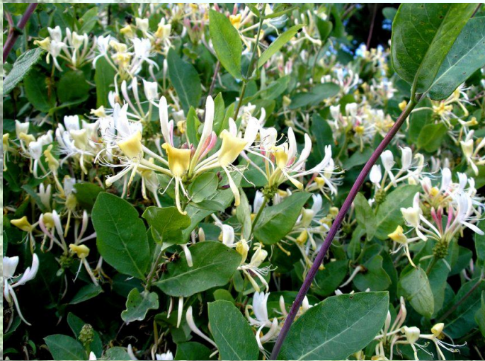
Blühende Pracht: Waldgeißblatt, eine häufig auf Wallhecken anzutreffende Lianenpflanze

Besonders zweckmäßig sind Flächen, die keiner intensiven landwirtschaftlichen Nutzung mehr unterliegen, so z.B. die Flächen privater Pferdehalter, von Hobby-Landwirten o .ä. Ansonsten sind Wallhecken-Neuanlagen z.B. auf Flächenrändern insbesondere entlang von Wirtschaftswegen und Straßen denkbar.