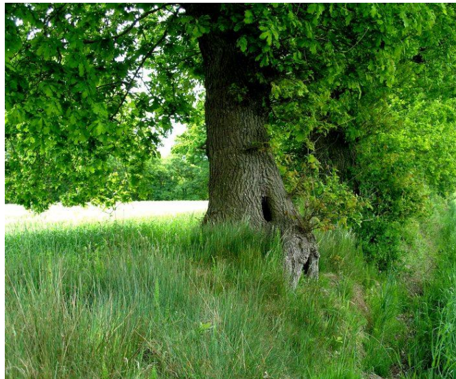
Alte Überhälter wie diese Walleiche sind für die Tierwelt von großer Bedeutung, in Astlöchern finden z.B. Höhlenbrüter wie der Buntspecht Brutgelegenheiten, oder Fledermäuse nutzen sie als Tagesquartier

Die daneben etablierten Wallhecken-Förderprogramme der EU und des Landes Niedersachsen bieten dagegen die Möglichkeit der finanziellen Unterstützung bei der Pflege und Instandsetzung alter Wallhecken. Die Betreuung erfolgt durch die Ostfriesische Landschaft.