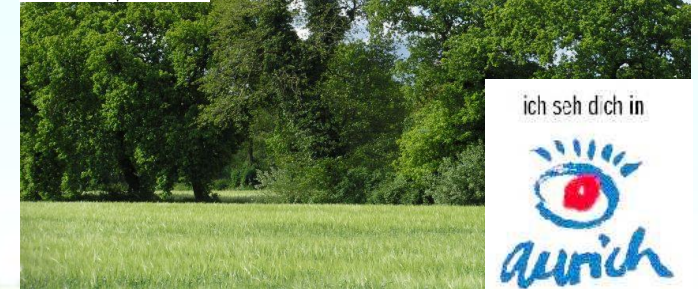
Die Umgebung Aurichs ist ohne Wallhecken nicht vorstellbar